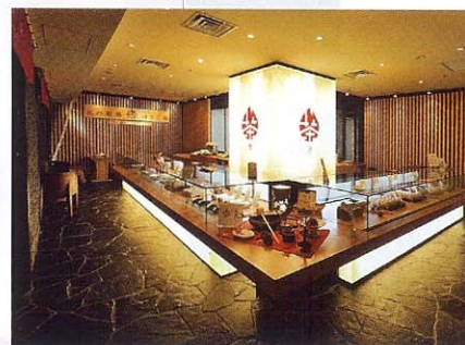
純和風の落ち着いた店内。奥にはフリーカフェスペースがある。ゆったりと茶の香りをくゆらせて楽しいひと時をどうぞ