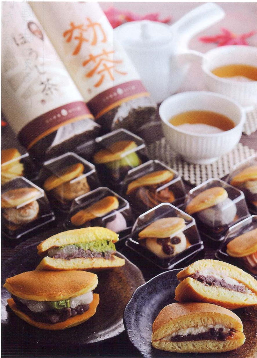
▲(手前から)「生どら」300円、「抹茶求肥」350円。季節限定のフレーバーも充実しており、様々な味が楽しめる。お土産やギフトに人気の「プチどらセット」(10個セット)1,575円。茶の香りを最大限に生かした「燻しほうじ茶」1,575円(180g)、甘みと香ばしさが飲みやすい「二十四種ふれんど効茶」1,050円(400g)

ここには、色々なお茶を無料で楽しめるスペースがある。頂けば、ほうじ茶がこれ程美味しいものとは、目からウロコであった。「一口含んだだけでその香りに体が包まれる感覚。ほのかな甘みは、街の喧噪を一瞬のうちに忘れさせ、心の芯を癒していく。聞けば、炒りあげた茶葉から出る煙で、さらに茶葉を燻し、その芳香な香りを閉じ込める匠の技。「ほうじ茶をもっと楽しんで欲しい」と、最上質のスイーツもズラリ。とりわけ、北海道産の「プチどら」は絶対のおすすめ。商品の全てが暮れのギフトにも最適であると断言しておく(天)