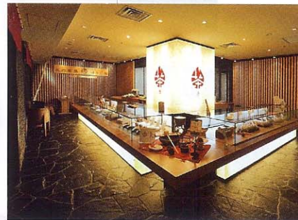
純和風の落ち着いた店内。奥にはフリーカフェスペースがある。ゆったりと茶の香りをくゆらせて楽しいひと時をどうぞ